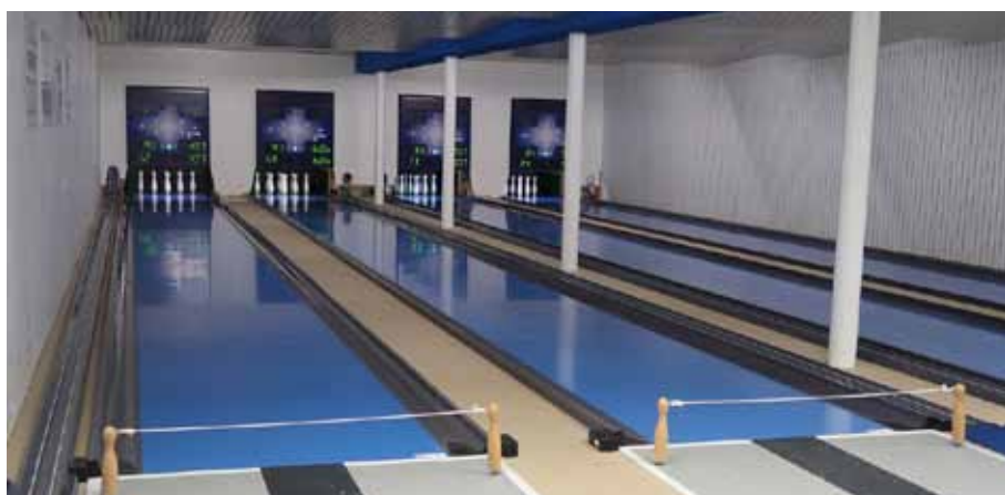
... und so sieht sie jetzt aus.

Bereits im Januar 2025 fiel mit einer Bemusterung und Werksführung bei der Firma Funk der Startschuss für das Großprojekt. Die Delegation des SV Weidenstetten war beeindruckt von den modernen Fertigungsmöglichkeiten und das breite Produktportfolio. Gemeinsam wurden dabei alle wichtigen Details besprochen: vom Anlauf über die Kugelaufflächen bis hin zu Kugelkästen und Plattenbelägen. Farblich blieb man dem Vereinscharakter treu – viele Elemente wurden in Blau gewählt, ergänzt durch helles Grau, das dem Raum eine moderne, freundliche Atmosphäre verleiht.