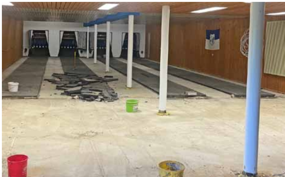
Der Umbau ...

Modern, hell und blau: Der Kegelbahnumbau ist vollbracht. Mit dem Umbau der vereinseigenen Kegelbahn hat der SV Weidenstetten im Frühjahr und Sommer 2025 nicht nur in moderne Technik investiert, sondern auch eindrucksvoll gezeigt, was möglich ist, wenn ein Verein zusammenhält. In enger Zusammenarbeit mit der Fachfirma Karl Funk GmbH & Co. KG aus der Nähe von Biberach und unterstützt durch viele freiwillige Helfer wurde die Bahn von Grund auf modernisiert.