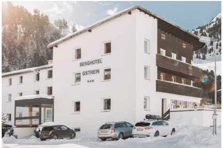
Das Hotel in Kramsach.

Im sogenannten Shit-Pin-Turnier, welches im Sprintmodus durchgeführt wurde und wo es zum Teil tolle Eins-gegen-Eins-Duelle gab, setzte sich bei den Frauen Jasmin