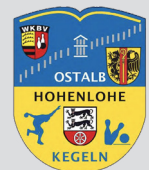
Bezirk Ostalb Hohenlohe Sektion Classic