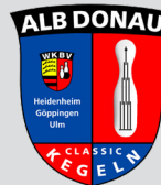
Bezirk Alb Donau Sektion Classic