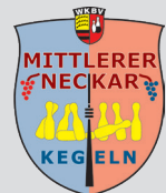
Bezirk Mittlerer Neckar Sektion Classic