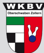
Bezirk Oberschwaben Zollern Sektion Classic