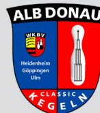
Bezirk Alb Donau Sektion Classic