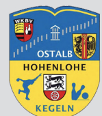
Bezirk Ostalb Hohenlohe Sektion Classic